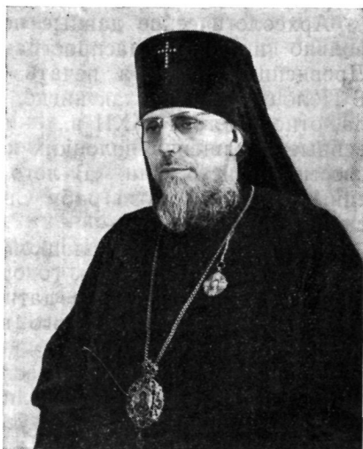
АНТОНИЙ, архиепископ Минский и Белорусский

В 1964 г. хиротонисан во епископа Белгород-Днестровского, викария Одесской епархии. В том же году за сочинение «Жировицкий монастырь в истории западнорусских епархий (1470—1956 гг.)» он удостоен степени магистра богословия. С 1965 г. — архиепископ Минский и Белорусский.