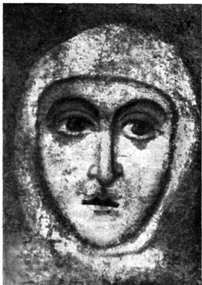
ГОЛОВА НЕИЗВЕСТНОЙ СВЯТОЙ (предположительно преп. Евфросинии)

Фреска в Спасском соборе Спасо-Евфросиниева монастыря в Полоцке